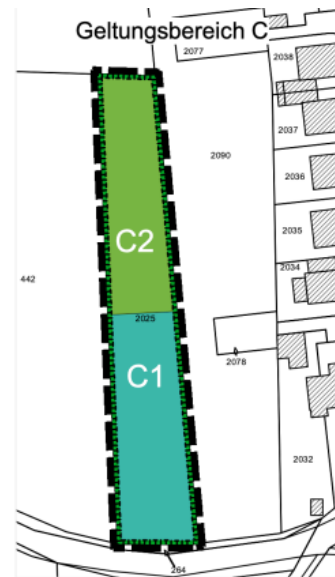
Abb.: Geltungsbereiche C1 der 5. Änderung des Bebauungsplanes Nr. 6 b, „Sandkämpe“ in der Gemarkung Drevenack, Flur 13, Flurstück 2025 (z.T.)