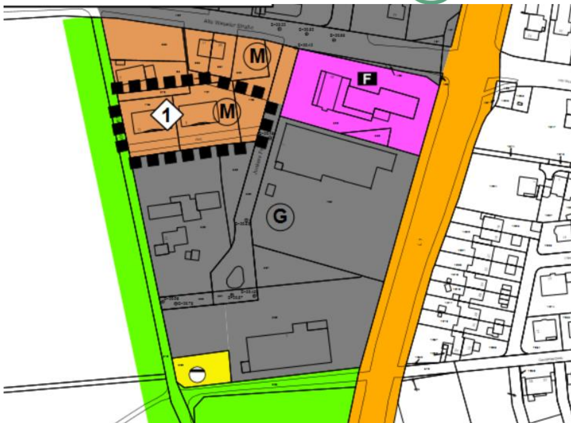
Abb.: Geltungsbereich der erneuten 49. Flächennutzungsplanänderung Ortsteil Hünxe in der Gemarkung Hünxe, Flur 5